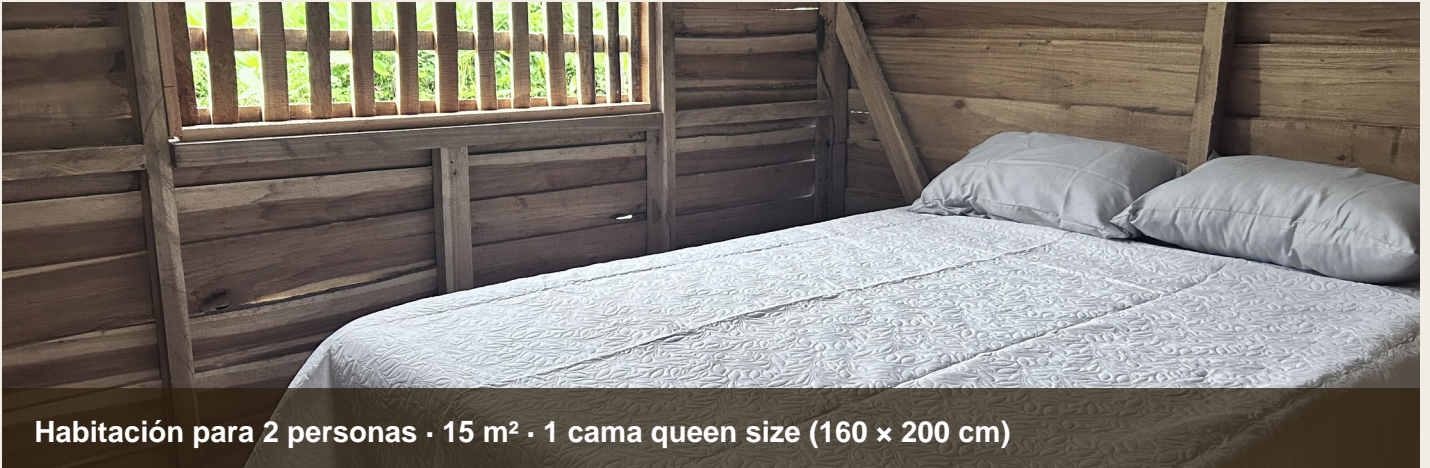
Habitación para 2 personas · 15 m 2 · 1 cama queen size (160 × 200 cm)