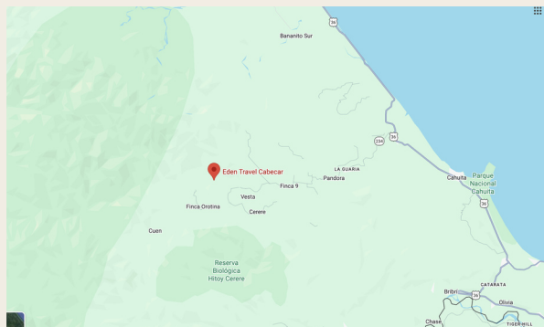
■ Eden Travel Cabécar – Reserva Indígena Tjái Sk, Valle Estrella