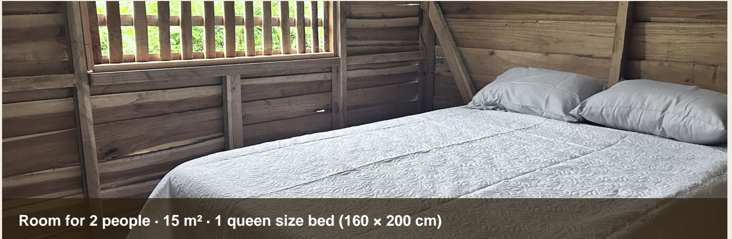
Room for 2 people · 15 m 2 · 1 queen size bed (160 × 200 cm)